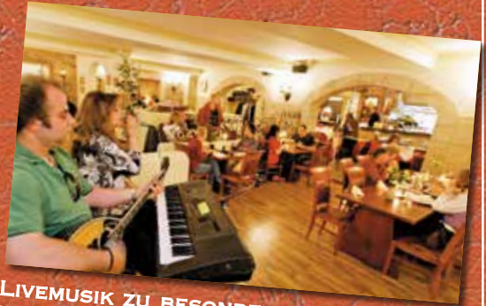
LIVEMUSIK ZU BESONDEREN TERMINEN UND AUF ANFRAGE