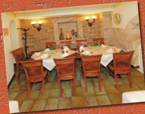
FESTE FEIERN IN ANGENEHMEM RAHMEN