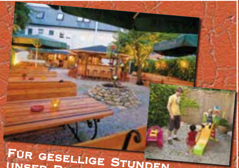
FÜR GESELLIGE STUNDEN UNSER BIERGARTEN LADT EIN - AUCH DIE KLEINEN